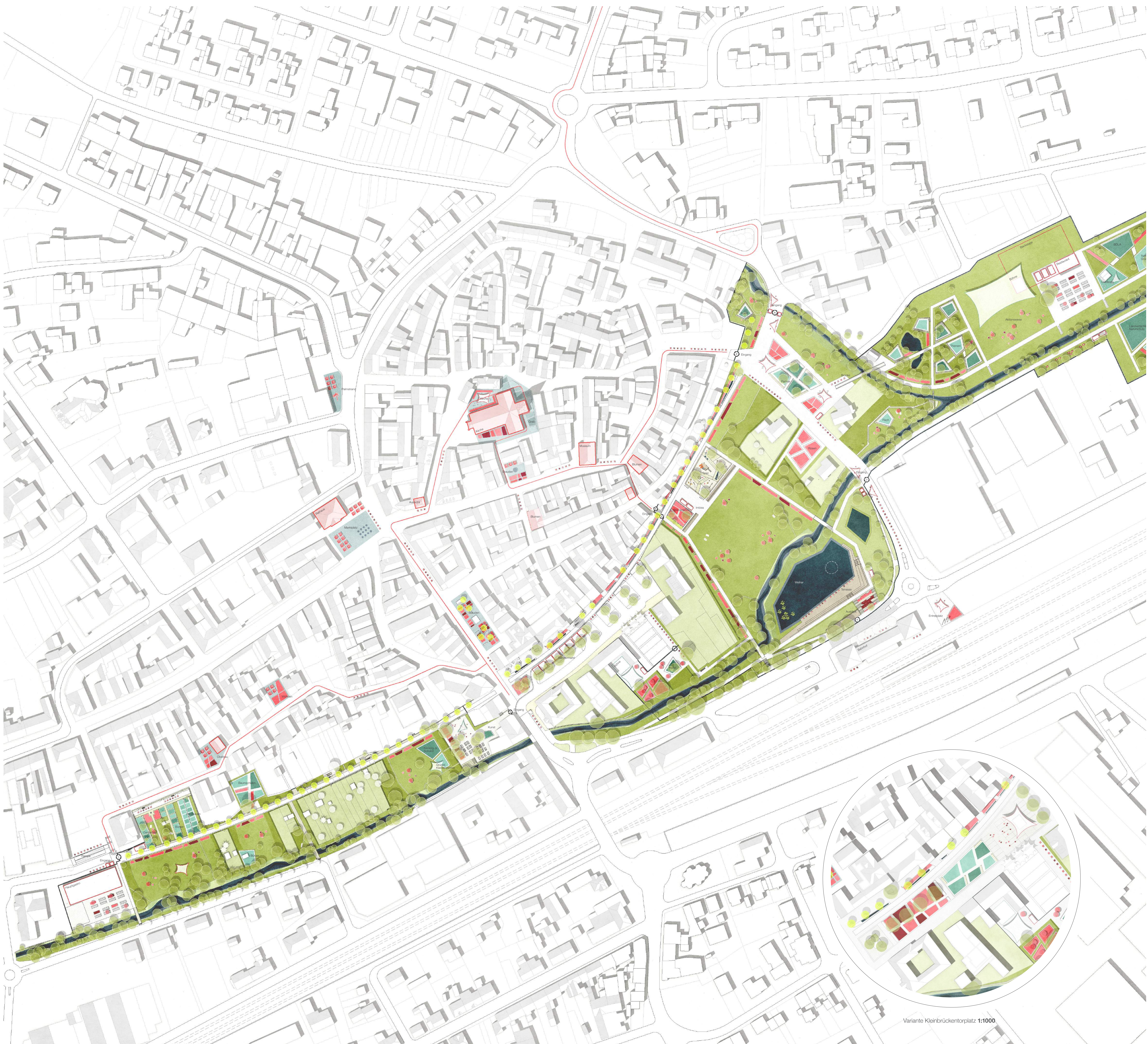
Variante Kleinbrückentorplatz 1:1000

Das Gegenüber von Altstadt und Weierpark bildet das Gesicht der Gartenschau und wird durch den Mühlenkanal und Steinplatz miteinander verzahnt. Daran anknüpfend spannt sich der Grünbogen auf und bietet spannende Kontraste zwischen typisch regionaler Lebensart entlang des Bachweges und Spiel, Spaß und Musik auf den Festwiesen. Die Ebene verbindet die Stationen und sorgt zwischen durch für erfrischende Abkühlung.