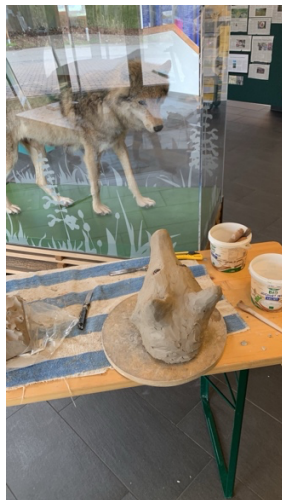
Bau eines Wolfes, mit einem Model aus dem Naturparkzentrum