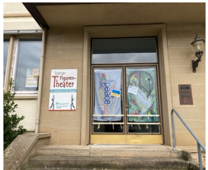
Aktionen für den Frieden