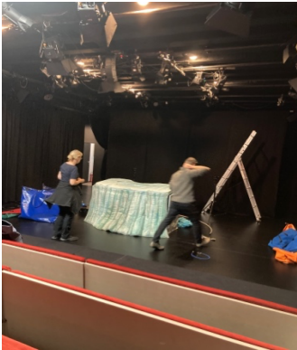
Aufbau Pit Pinguin, Marotte Figurentheater