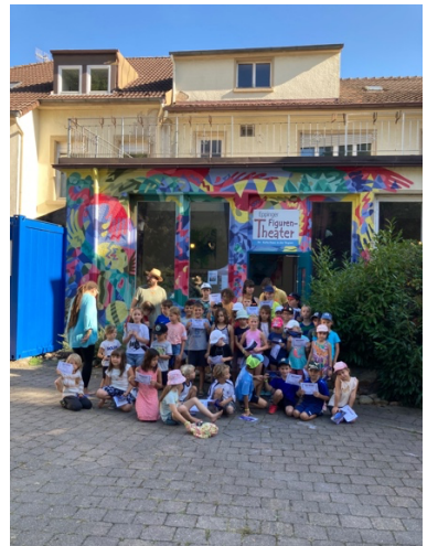
Abschluss der Sommerolympiade