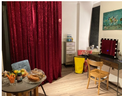
Die Garderobe ist bereit für die Künstler:innen