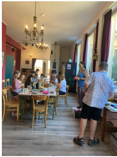
Ferienprogramm im EpFi