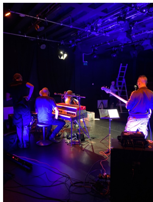
Aufbau Jazz in der Altstadt