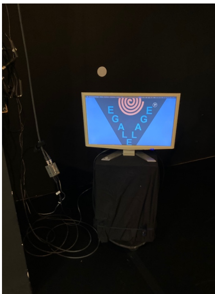
Aufbau Egale Lage, HMDK Fachbereich Figurentheater