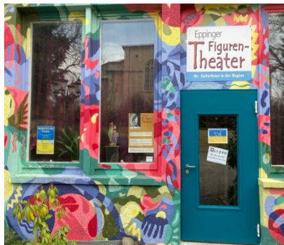
Aktionen für den Frieden