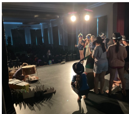
Probe von „Nanu, ein Fuß“