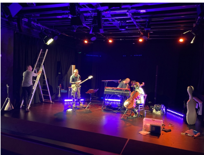
Aufbau Jazz in der Altstadt