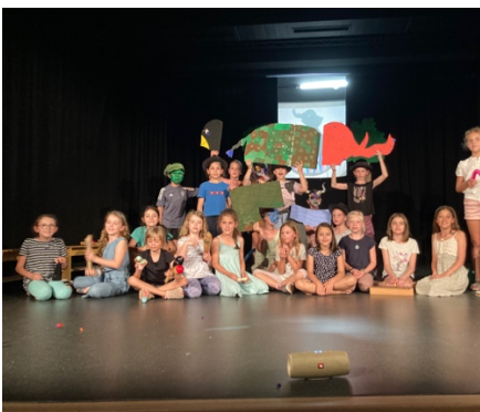
Premiere des Schultheaterprojekts „Nanu, ein Fuß“