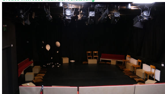
Kleinkindgerechter Aufbau des Zuschauer:innenraums