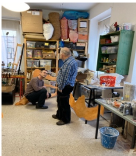
Besprechung neue Produktion