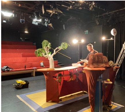
Aufbau Weihnachten in Koala-Land, Eppinger Figurentheater