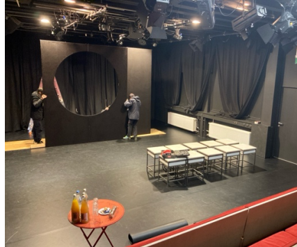
Aufbau „Mädchen mit Hutschachtel“