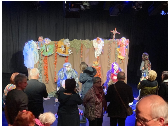
Großes Interesse nach der Vorstellung