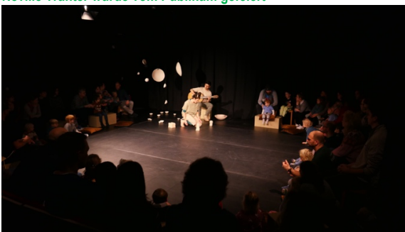
Ton in Ton – Theater für Kinder schon ab 1,5 Jahre