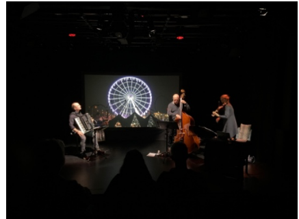
Inseln, Trio Youlaki, abtauchen in bewegten Bildern