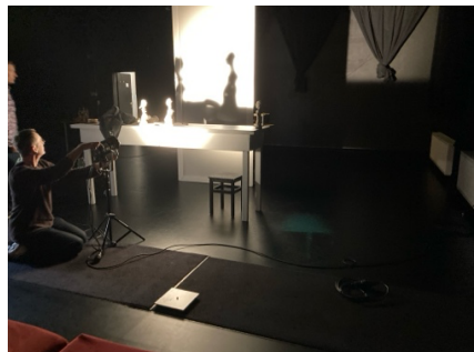
Einleuchten „Adams Äpfel“, Marotte Figurentheater