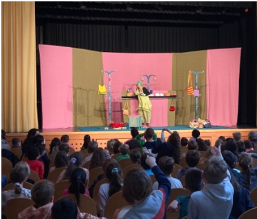
Figurenspiele auf Abstecker in Schwaigern, Auftritt für Flüchtlingskinder, Oh! Wo? Na da!, Eppinger Figurentheater