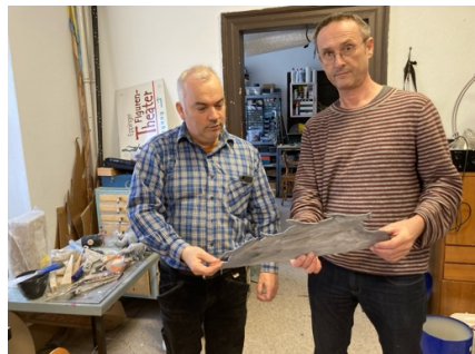
Besprechung neue Produktion, Zotz/Zürn