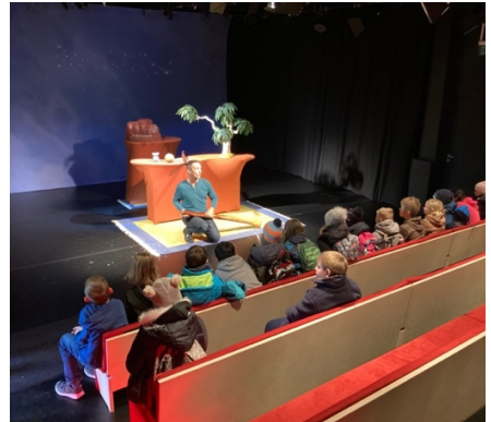
Nachgespräch Weihnachten in Koala-Land