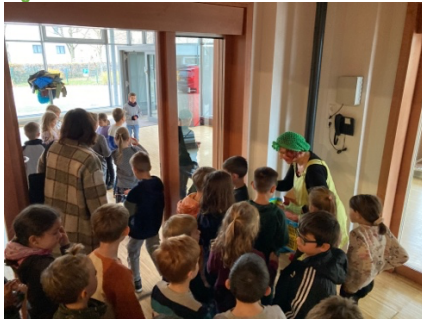
Jedes Kind bekommt ein Memospiel vom Theaterstück geschenkt