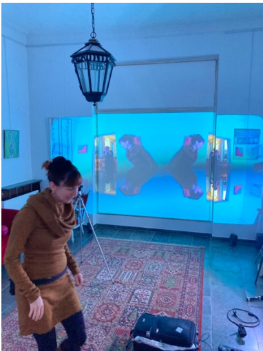
Aufbau interaktive Videoinstallation, IMAGINALE