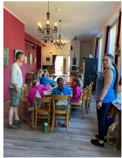
Ferienprogramm im EpFi