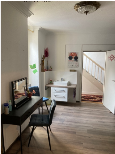
Umbau der Künstler:innengarderobe