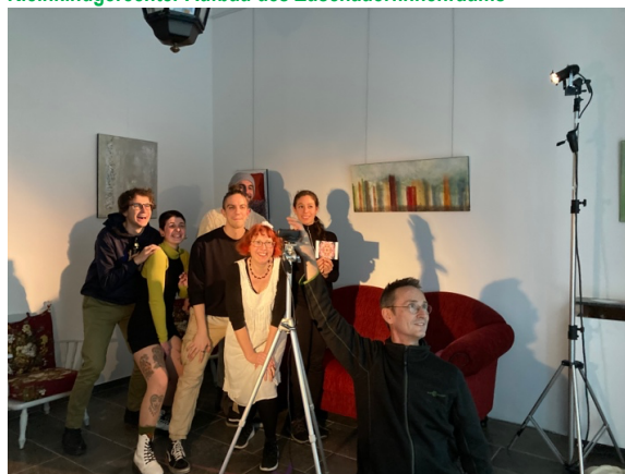
Auch die Figurenspieler:innen haben Spaß an der interaktiven Videoinstallation