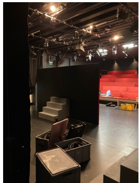
Aufbau Egale Lage, HMDK Fachbereich Figurentheater