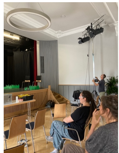
Aufbau und Probe von „Nanu, ein Fuß“