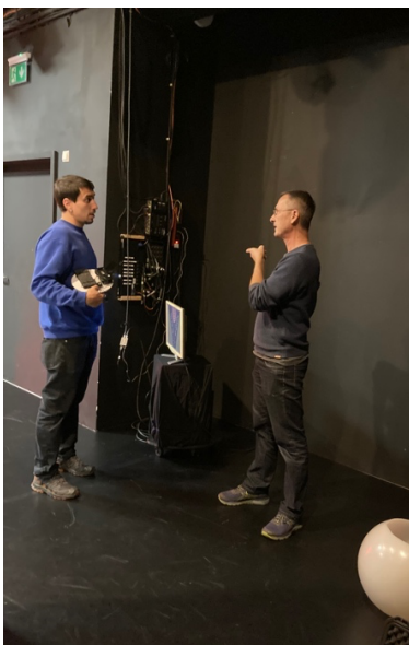
Aufbau Egale Lage, HMDK Fachbereich Figurentheater